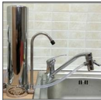
Συσκευή συνδεδεμένη σε βρύση κουζίνας

ΕΛΛΗΝΙΚΟ ΠΡΟΪΟΝ ΚΑΤΑΣΚΕΥΑΣΤΗΣ: CENTER PLUS SA